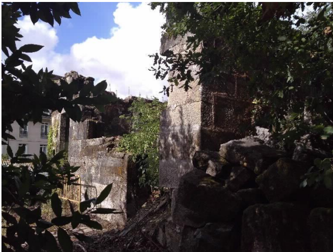
Chalé de Don Luís lateral