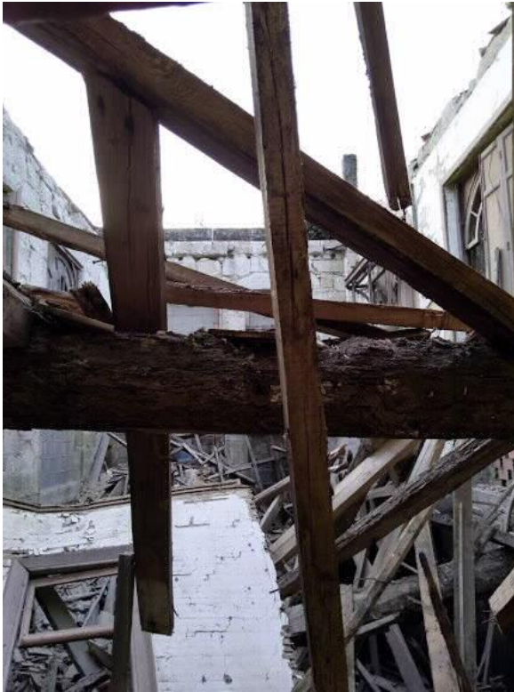
Interior Fonte de Troncoso.

Rúa do Hórreo, s/n. Tel. 0034 981 551 545 Fax. 0034 981 551 420. Fax prensa: 0034 981 551 421 gp-bng@parlamentodegalicia.gal 15702 Santiago de Compostela Galiza