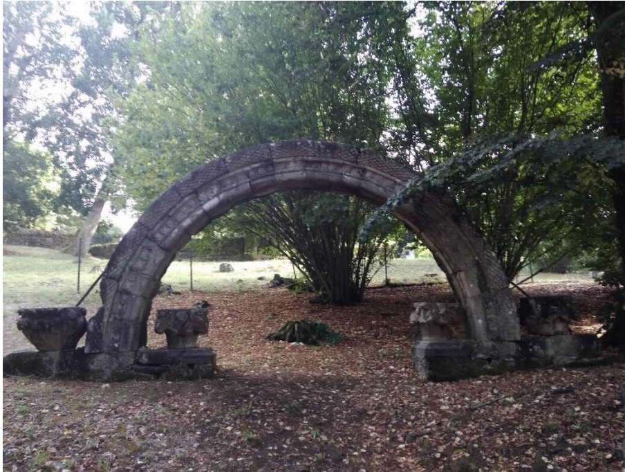
Arco Románico completo