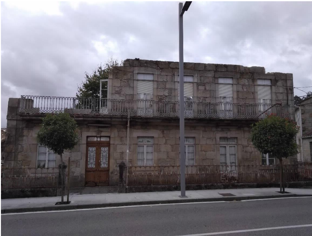
Hotel Roma Fachada