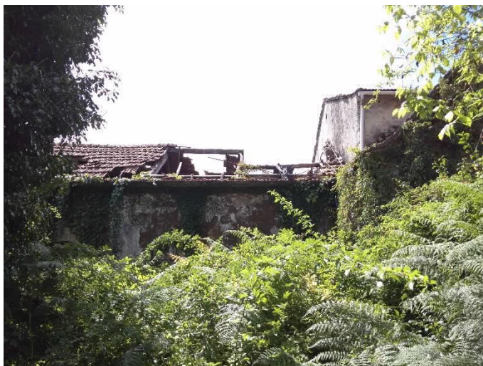
Chalet Villa Flora frontal e cuberta