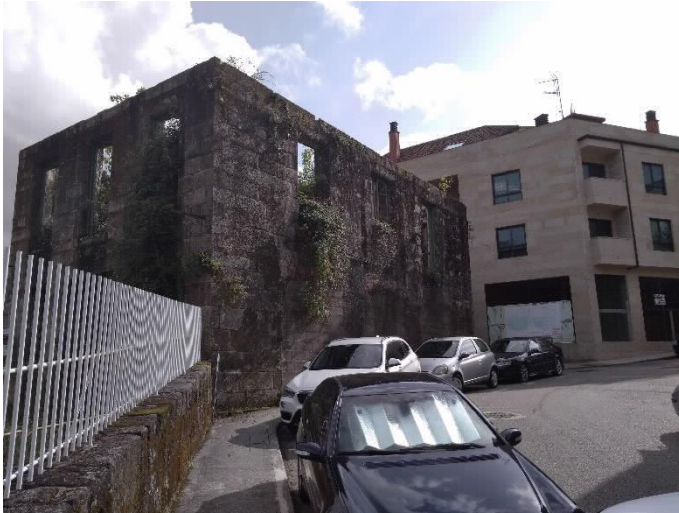
Chalé de Don Jaime lateral Norte