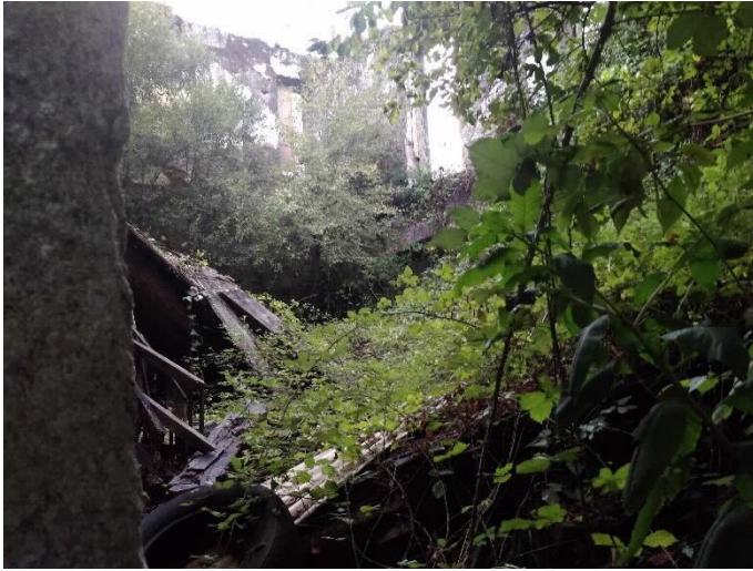
Chalé de Don Jaime interior

Rúa do Hórreo, s/n. Tel. 0034 981 551 545 Fax. 0034 981 551 420. Fax prensa: 0034 981 551 421 gp-bng@parlamentodegalicia.gal 15702 Santiago de Compostela Galiza