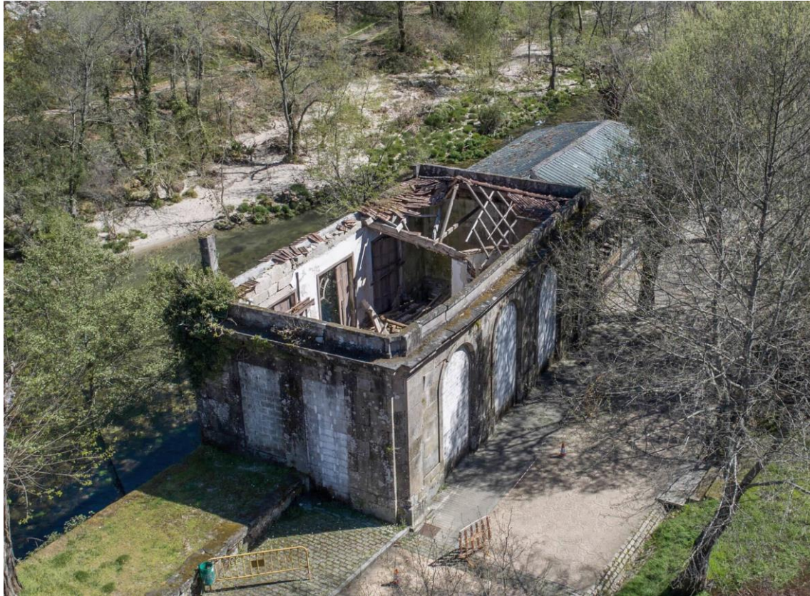
Fonte de Troncos vista aérea.

Rúa do Hórreo, s/n. Tel. 0034 981 551 545 Fax. 0034 981 551 420. Fax prensa: 0034 981 551 421 gp-bng@parlamentodegalicia.gal 15702 Santiago de Compostela Galiza