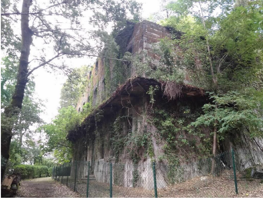
Chalé de Dona María fachada e lateral Sur