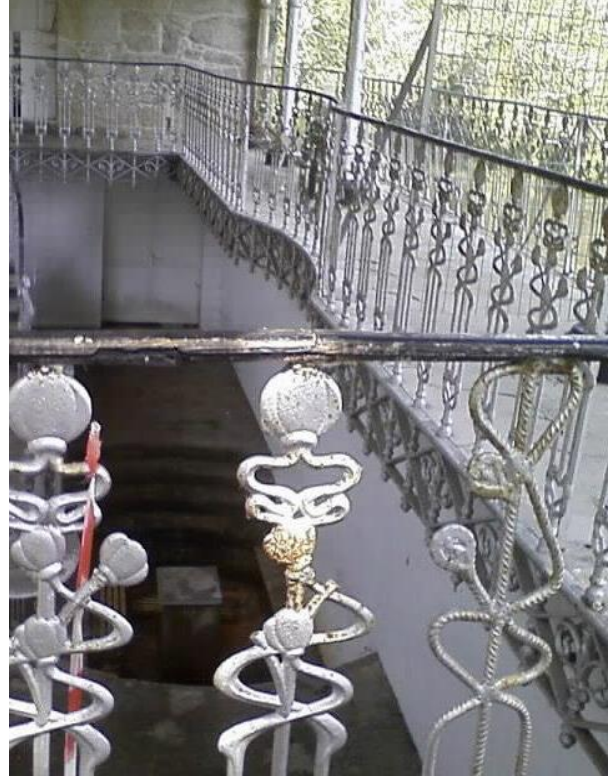
Interior Fonte Troncoso (forxa)