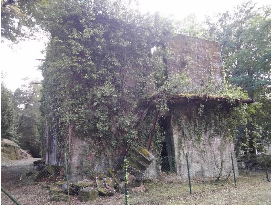
Chalé de Dona María Lateral Norte e traseira

OFICINA PARLAMENTAR Parlamento de Galiza Rúa do Hórreo, s/n. Tel. 0034 981 551 545 Fax. 0034 981 551 420. Fax prensa: 0034 981 551 421 gp-bng@parlamentodegalicia.gal 15702 Santiago de Compostela Galiza