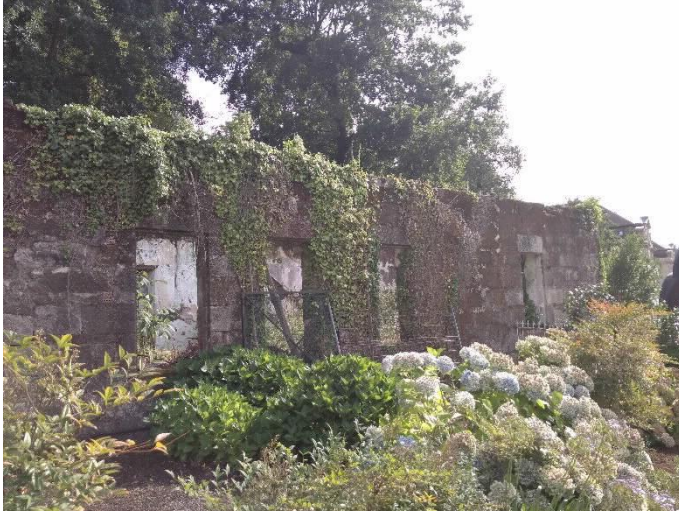
Chalé de Don Luís lateral Norte