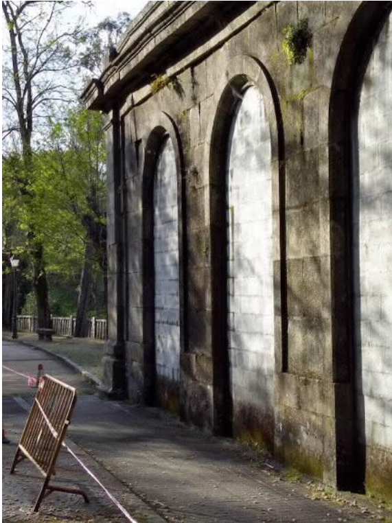
Pared lateral pos derrubamento 2019. (Baranda)