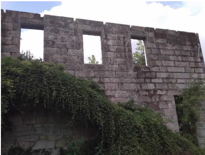
Chalé de Don Jaime lateral Sur