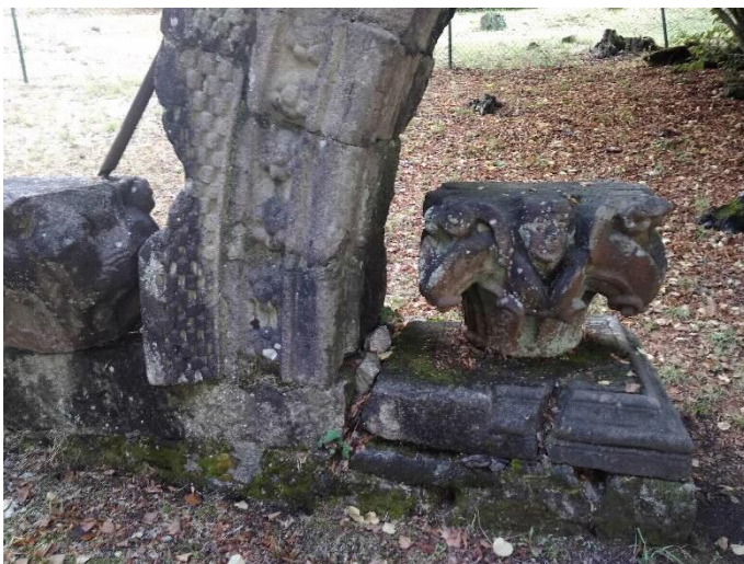
Arco Románico detalles