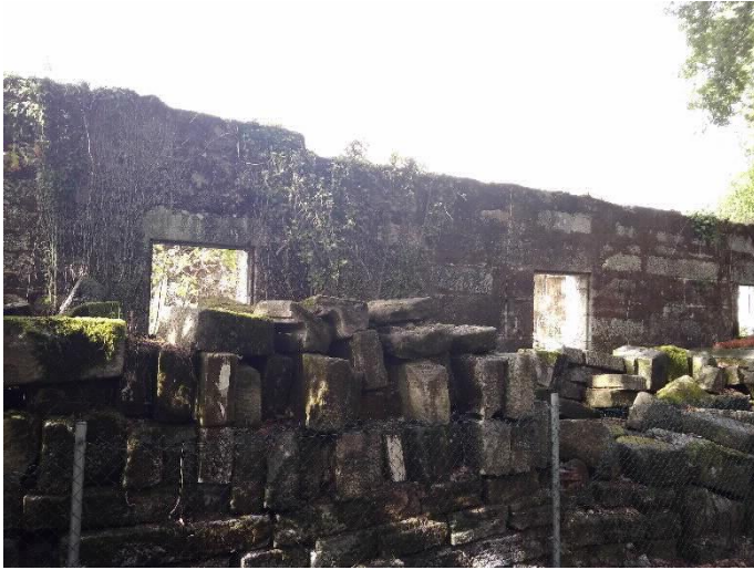
Chalé de Don Luís lateral Sur e pedras da planta derrubada.

Rúa do Hórreo, s/n. Tel. 0034 981 551 545 Fax. 0034 981 551 420. Fax prensa: 0034 981 551 421 gp-bng@parlamentodegalicia.gal 15702 Santiago de Compostela Galiza