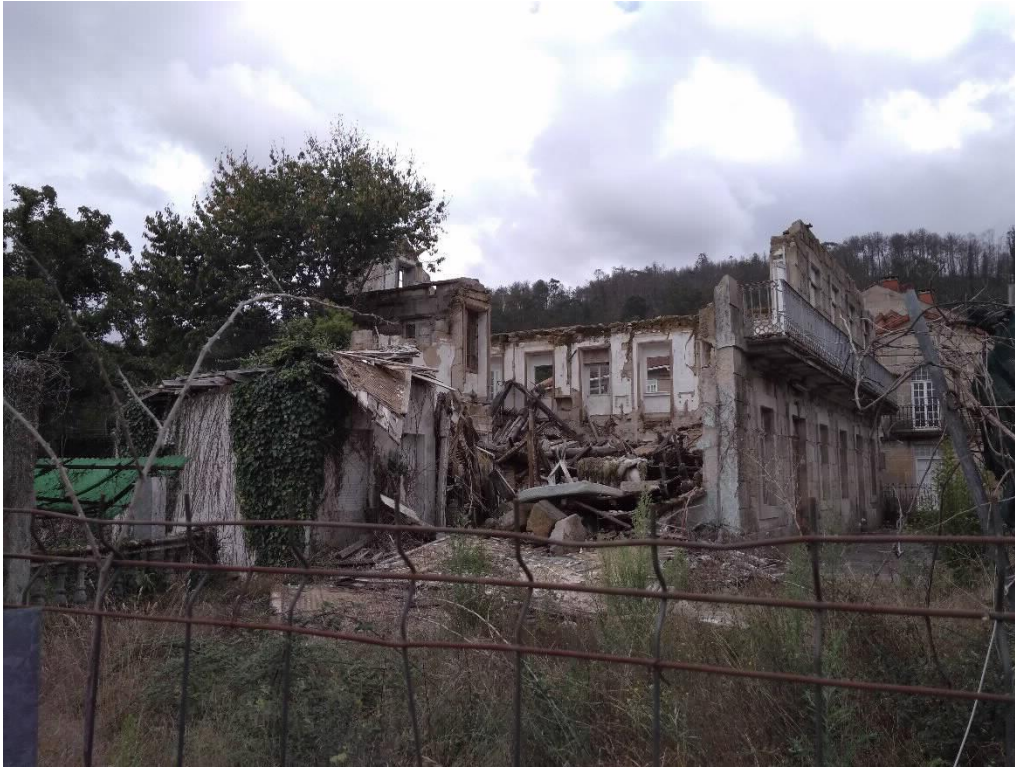
Hotel Roma Lateral Este

Rúa do Hórreo, s/n. Tel. 0034 981 551 545 Fax. 0034 981 551 420. Fax prensa: 0034 981 551 421 gp-bng@parlamentodegalicia.gal 15702 Santiago de Compostela Galiza