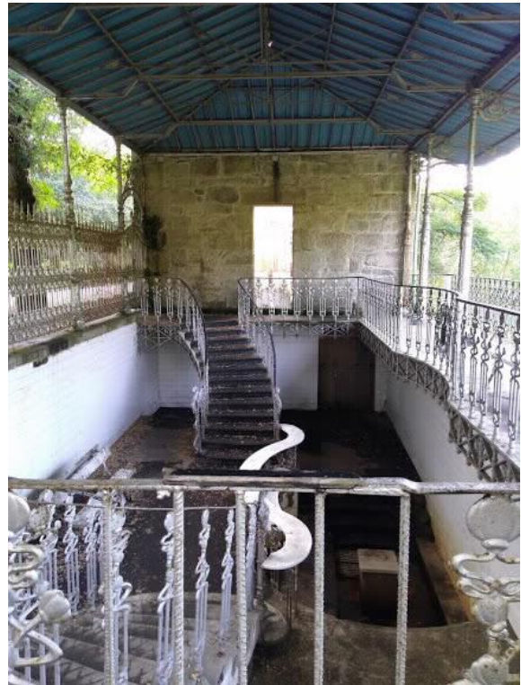
Interior Fonte de Troncoso