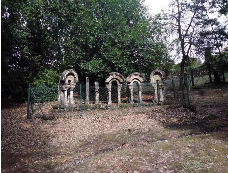
Xanelas Románicas completo