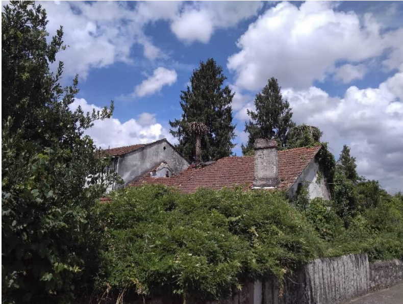
Chalet Villa Flora lateral Este e cuberta.