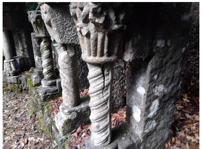
Xanelas Románicas detalle